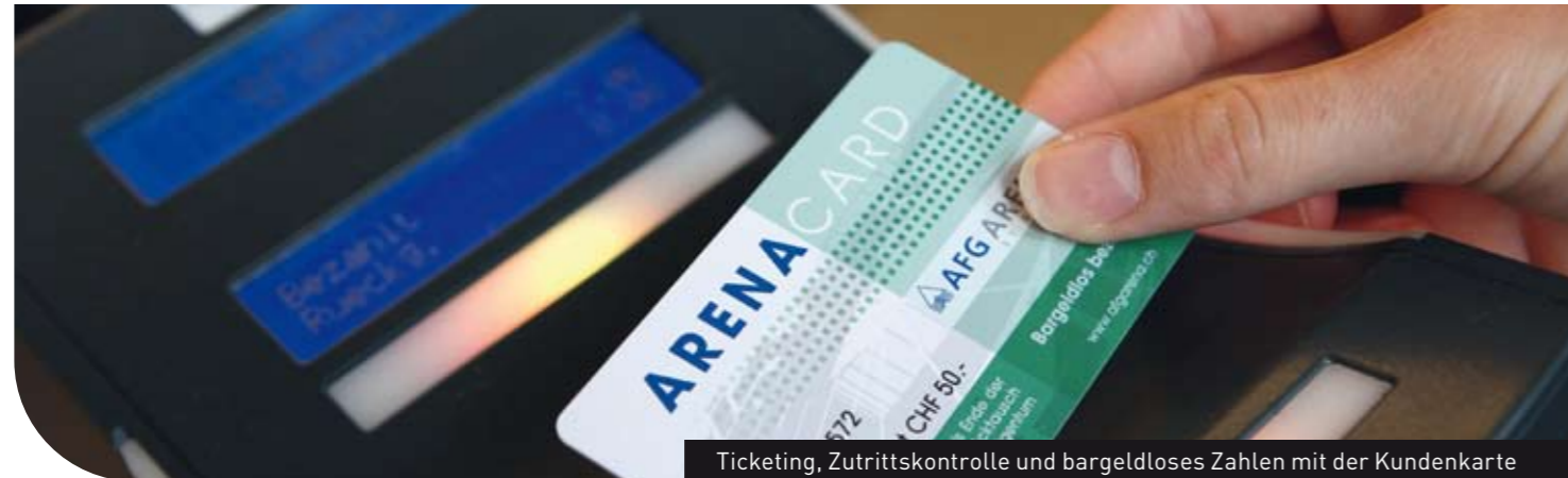
Ticketing, Zutrittskontrolle und bargeldloses Zahlen mit der Kundenkarte