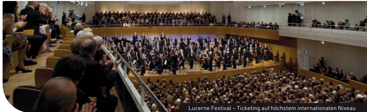
Lucerne Festival – Ticketing auf höchstem internationalen Niveau